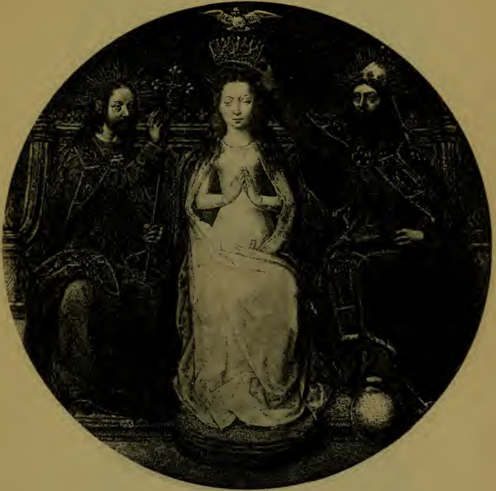
Le Couronnement de Sainte-Ursule faite de la Châsse de Sainte Ursule.